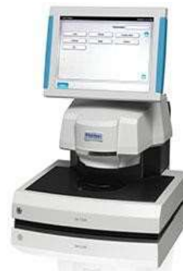
شرکت سازنده perten, سوئد مدل: 7250DA