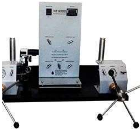
دستگاه اندازه گیری کشش سطحی و زاویه تماس

شرکت سازنده: فناوری ازدیاد برداشت فارس کشور ایران