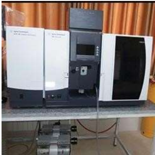
طیف سنجی جذب اتمی Atomic Absorbtion شرکت سازنده Agilent: کشور آمریکا مدل: FSAA240