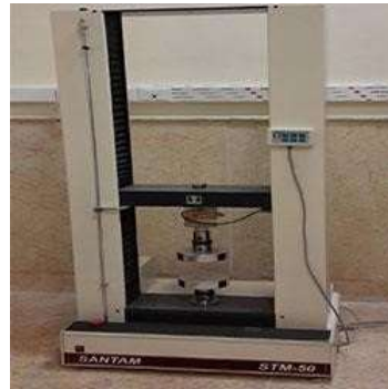
دستگاه تست کشش و فشار یونیورسال 5 تنی

دستگاه تست کشش و فشار یونیورسال 5 تنی شرکت سازنده: سنتام کشور ایران مدل 20STM