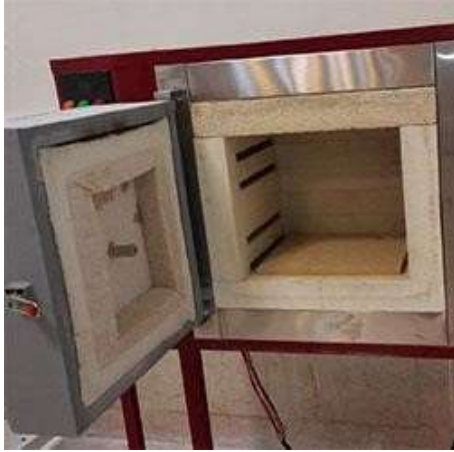
کوره الکتریکی (Electrical Furnace)

شرکت سازنده: صنعت سرام کشور ایران مدل 32KL