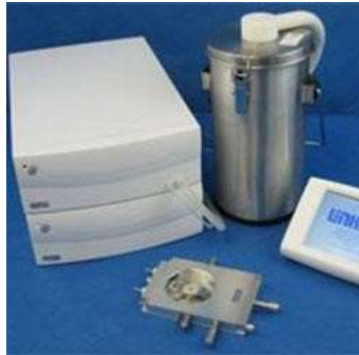
شرکت سازنده Linkham: کشور انگلستان مدل: THMSG600