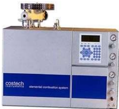
نام فارسی دستگاه: آنالیز عنصری CHNS-O نام لاتین دستگاه: CHNS-O Elemental Analyzer مدل دستگاه: ECS 4010